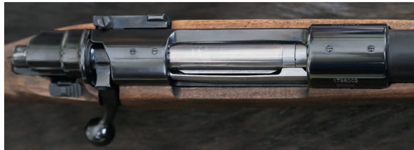
Для крепления планки типа «пикатини» в ствольной коробке карабина предусмотрены четыре резьбовых отверстия. При отсутствии планки отверстия закрыты винтами