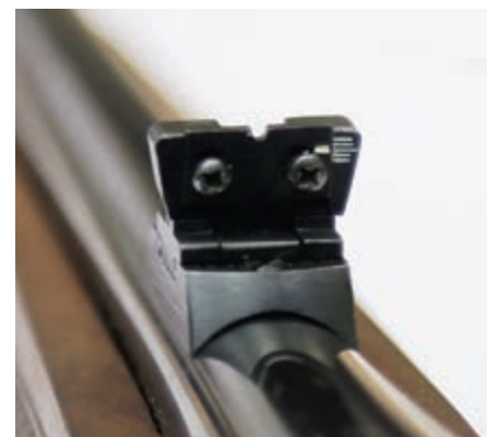
На стволе установлены прицельные приспособления карабина М70. Ствол оборудован регулируемым в двух направлениях, складывающимся вперёд целиком и неподвижной мушкой

Наиболее ярким визуальным отличием ТК598 от остальных «маузеров», станет оригинальная и очень функциональная ореховая ложа, разработанная маститым оружейным дизайнером в содружестве с опытными конструкторами. Для достижения максимальной стабильности,