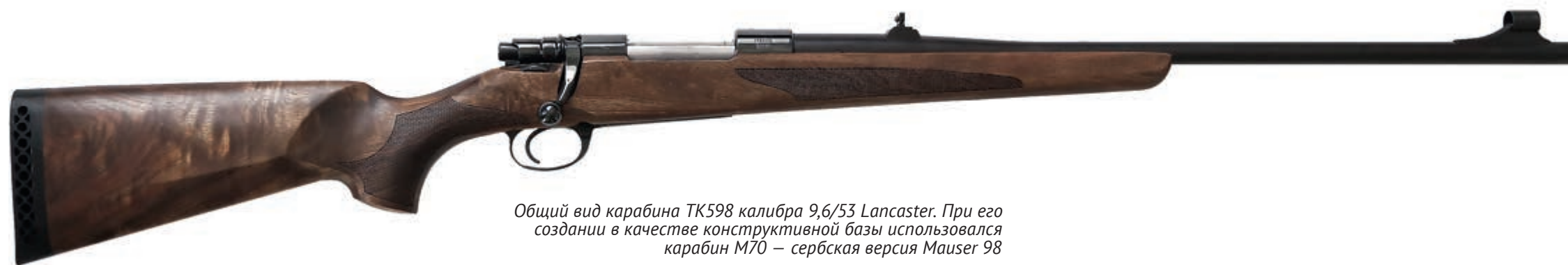
Общий вид карабина ТК598 калибра 9,6/53 Lancaster. При его создании в качестве конструктивной базы использовался карабин M70 — сербская версия Mauser 98

В качестве дальнейшего пути продвижения нового калибра на российский рынок «Ижевский арсенал» и «Техкрим» видят в выпуске классических моделей длинноствольного оружия. Одним из них стал карабин ТК598 калибра 9,6/53 Lancaster, при создании которого в качестве конструктивной базы использовался карабин M70 — сербская версия Mauser 98. Выбор данного образца обусловлен отличным сочетанием цены и высоких потребительских свойств, надёжностью и обработанностью конструкции исходной модели.