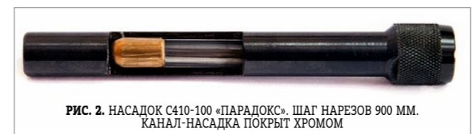
РИС. 2 НАСАДОК С410-100 «ПАРАДОКС». ШАГ НАРЕЗОВ 900 ММ. КАНАЛ-НАСАДКА ПОКРЫТ ХРОМОМ

В начале пути был калибр .410. Нам хотелось превратить его из «развлекательного» в пулевой, а в идеале – в надёжный и кучный охотничий. Первоначально мы улучшили форму закатки и размеры патронов для надёжной работы в «Сайге-410». Для обеспечения надёжной работы автоматики при минусовых температурах и повышения энергии до 1500 Дж придумали улучшение амортизации пробковым гранулятом. Для повышения кучности отработали параметры насадка «парадокс» (рис. 2) и освоили новые пули.